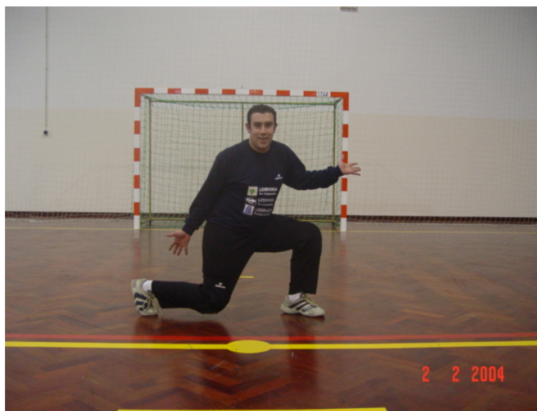
Parede mal feita

A maior parte dos golos sofridos pelos GR em situação de 1xGR é por entre as pernas, ou em situações em que sai precipitadamente da baliza chegando à bola depois do adversário.